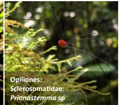
Opiliones: Sclerosomatidae: Prionostemma sp

Reviewed by: Carlos Viquez