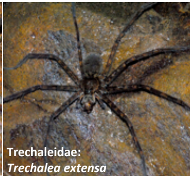
Trechaleidae: Trechalea extensa