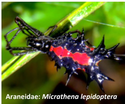
Araneidae: Micrathena lepidoptera