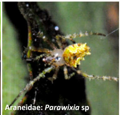
Araneidae: Parawixia sp