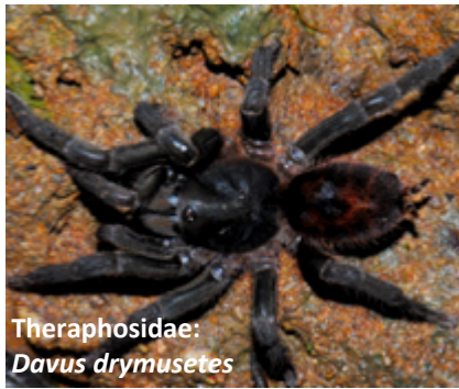
Theraphosidae: Davus drymusetes