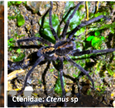
Ctenidae: Ctenus sp