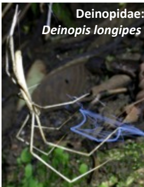
Deinopidae: Deinopsis longipes