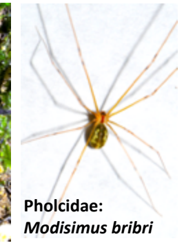
Pholcidae: Modisimus bribri