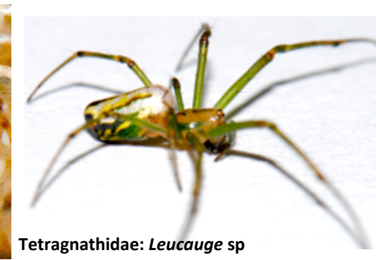
Tetragnathidae: Leucauge sp