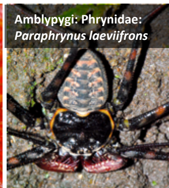
Amblypygi: Phrynidae: Paraphrynus laevifrons