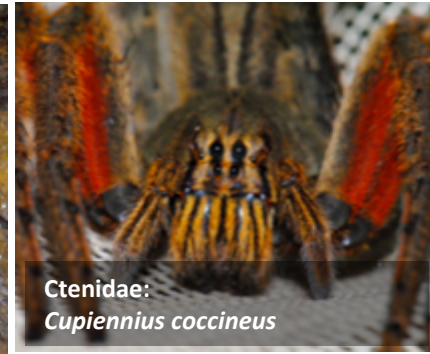
Ctenidae: Cupiennius coccineus